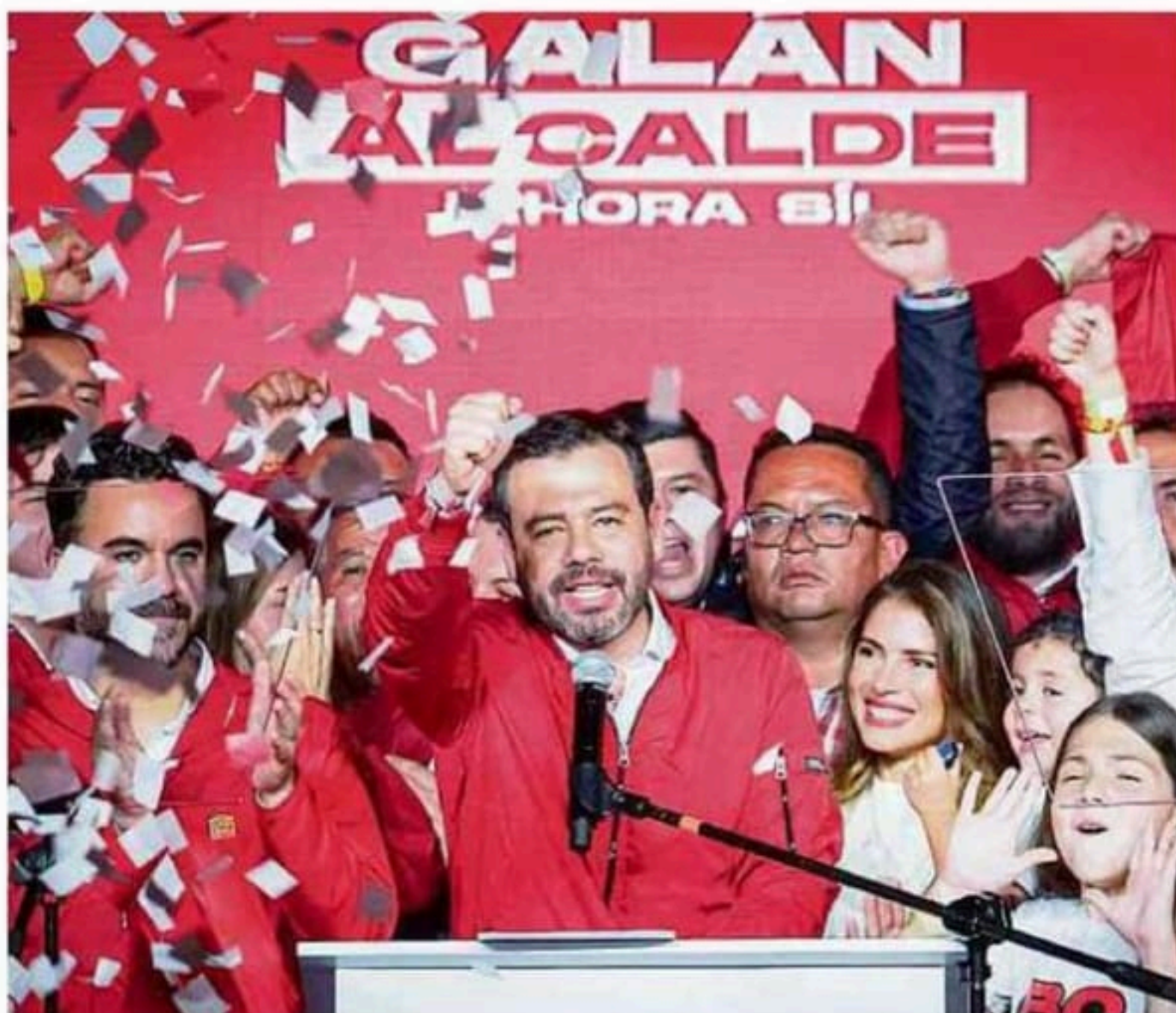
Galán consiguió el triunfo en primera vuelta, dejando atrás a Oviedo y a Bolívar.

Con 1'497.596 votos, el 49,02 por ciento del total de sufragios depositados en la jornada del 29 de octubre, Carlos Fernando Galán fue elegido alcalde de Bogotá para el periodo 2024-2027. Con este resultado se cumplieron los requisitos para que los bogotanos no tuvieran que volver a las urnas 20 días después. En su tercera candidatura a la alcaldía, Galán logró posicionarse en el centro del espectro político y superó a sus predecesores, con lo que se convirtió en el principal elector en la capital, lo que, a juzgar por los analistas, le da plena legitimidad y reconfirma que Bogotá es una ciudad independiente, que privilegia el voto de opinión y busca el equilibrio de poderes frente al presidente de turno.